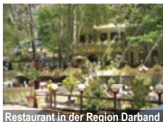
Restaurant in der Region Darband

Die zweitgrößte Stadt Irans, Hauptstadt der Provinz des Landes, Khorasan. Unterkunft im Hotel Homa 2 (*****). Wir besichtigen u.a. das Heiligtum des Imam-Raza und machen eine Stadtbesichtigung. Am Abend folgen wir der Einladung des Veters von Hassanzadeh zu einem privaten Dinner mit gemütlichem Ausklang. Am nächsten Tag Ausflug nach Nishapur zum Mausoleum von Omar Khayam und Besuch einer Karawanserei. Abend-Dinner im Hotel Homa 2. Am nächsten Morgen besuchen wir ein Kinderheim, dass vom Verein „Saarländische-Iranische Hilfe für Kinder e.V.“ unterstützt wird. Außerdem besuchen wir den schönen Bazar der Stadt mit Einkaufsmöglichkeiten. Am Nachmittag Weiterflug nach Teheran.