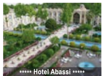
**** Hotel Abassi ****