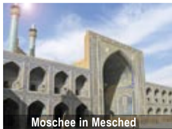
Moschee in Mesched

Die zweitgrößte Stadt Irans, Hauptstadt der Provinz des Landes, Khorasan. Unterkunft im Hotel Homa 2 (*****). Wir besichtigen u.a. das Heiligtum des Imam-Raza und machen eine Stadtbesichtigung. Am Abend folgen wir der Einladung des Veters von Hassanzadeh zu einem privaten Dinner mit gemütlichem Ausklang. Am nächsten Tag Ausflug nach Nishapur zum Mausoleum von Omar Khayam und Besuch einer Karawanserei. Abend-Dinner im Hotel Homa 2. Am nächsten Morgen besuchen wir ein Kinderheim, dass vom Verein „Saarländische-Iranische Hilfe für Kinder e.V.“ unterstützt wird. Außerdem besuchen wir den schönen Bazar der Stadt mit Einkaufsmöglichkeiten. Am Nachmittag Weiterflug nach Teheran.