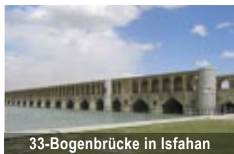
33-Bogenbrücke in Isfahan

Iranische Hauptstadt seit 1789, heute ca. 16 Mio. Einwohner. Unterkunft im 5-Sterne-Hotel Laleh (*****). Besichtigung des Archäologischen Museums, Kronjuwelenmuseum, Schahpaläste. Besuch der traditionellen Restaurants in der Stadt. Am 3. Tag nachmittags Weiterflug nach Isfahan.