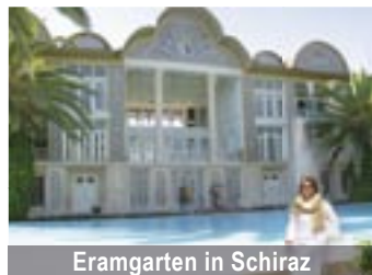
Eramgarten in Shiraz